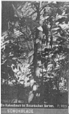
Ein Kakaobaum im Botanischen Garten.