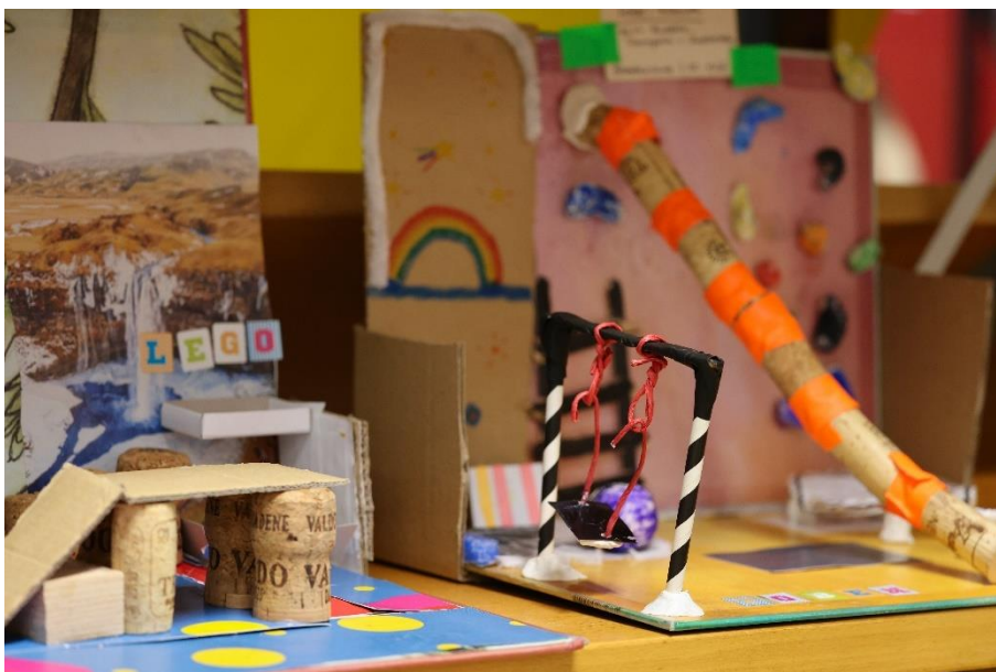
Bibliotheksmodell aus der „Bib, bib, hurra!“ Zukunftswerkstatt

Aufwachsen in einer medialen Welt: Eine moderne Großstadtbibliothek erfüllt die Bedürfnisse vieler Zielgruppen. Die große Gruppe der Kinder und Jugendlichen und das Thema Lese- und Sprachförderung liegen uns dabei besonders am Herzen. Deshalb macht die Münchner Stadtbibliothek vielfältige, immer wieder neue, aber auch lang bewährte Angebote für Heranwachsende, zum Erleben, Lesen und Mitgestalten. Mit 2.667 Veranstaltungen machen sie fast die Hälfte unserer Programmarbeit aus.