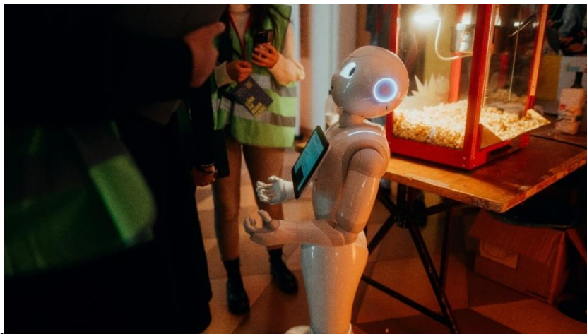
Roboter beim Stadtratshearing am 5.Oktober 2023

Die Münchner Stadtbibliothek hat die Veränderungen, die mit der Digitalisierung der Lebenswelten einher gehen, stets als große Chance begriffen. Im Zentrum unseres digitalen Engagements stehen die zahlreichen und vielfältigen Möglichkeiten des Austauschs, der Zusammenarbeit und der Teilhabe an Wissen, Bildung und Kultur, die eine digitale Gesellschaft für alle Menschen bietet. Außerdem soll die kritische Auseinandersetzung mit den Gefahren sowie die digitale Mündigkeit gefördert werden.